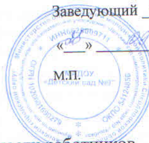
График сменности работников

Муниципального автономного дошкольного образовательного учреждения «Детский сад комбинированного вида №9 «Улыбка»